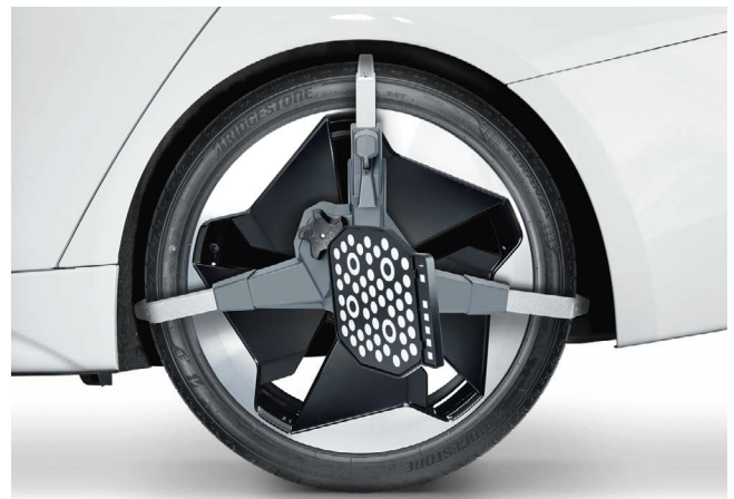
Q.Grip: Schneller aufspannen als alle anderen