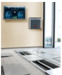
Pkw-Bremsenprüfstand BD 4182 Artikelnummer: 1 691 600 670