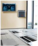
Pkw-Bremsenprüfstand BD 4132 Artikelnummer: 1 691 600 642