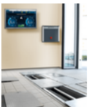
Pkw-Bremsenprüfstand BD 4482 Artikelnummer: 1 691 600 888